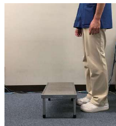
⑤ もう片方の脚を下ろす。