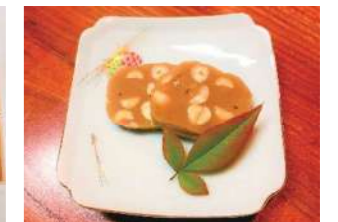
【ご当地メニュー例】 熊本のとじこ豆