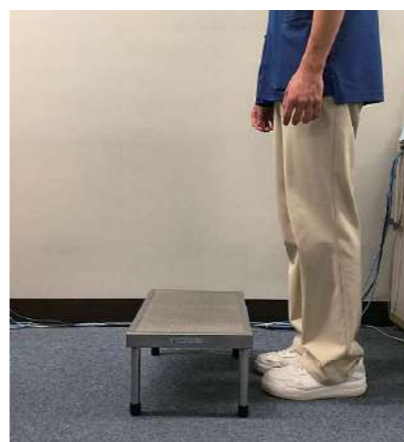
① 10cm程の高さの段差の前に立ちます。

転びにくい体を作るために大切な下肢(脚)を鍛える簡単な運動を紹介します。 10cm程度の段差(玄関や階段)を利用して、「踏み台昇降」運動を行います。