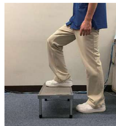
② 片方の脚を台の上に乗せる。