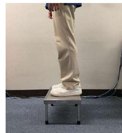
③ もう片方の脚を台に乗せる。