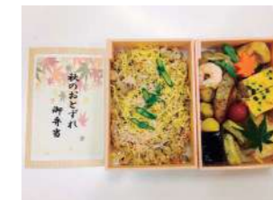
【行事食例】 秋のおとずれ御弁当